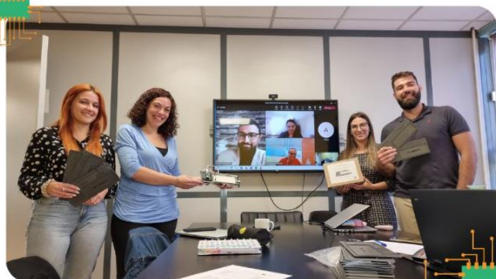
Athens, Greece 07/10/2022

Newsletter br. 2, Prosinac 2022, Projekt N°: 2021-1-FR01-KA220-SCH-000031617